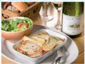
Croûte 3 vallées