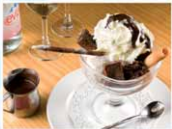
Coupe Ch'ti Charivari